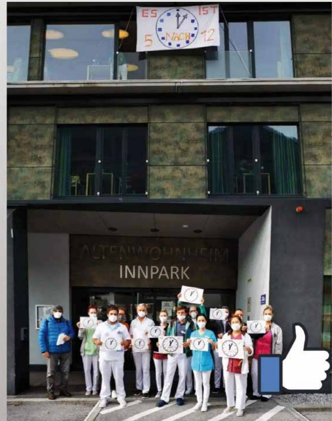
Wir möchten uns ganz herzlich bei ALLEN, die diese Aktion unterstützt haben, bedanken!