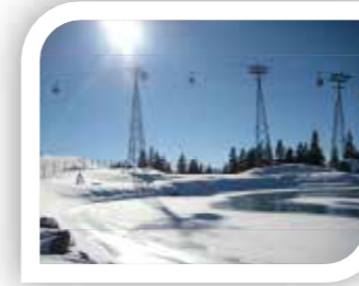
younion Tirol _ Die Daseinsgewerkschaft